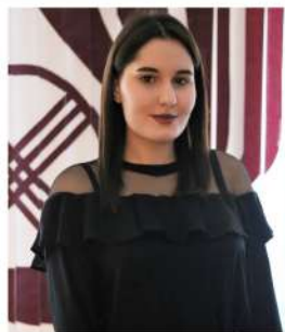
Крикова Любовь Автор