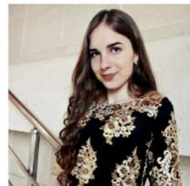
Трясак Валерия Корреспондент

В первой части Дня открытых дверей гостям на выбор были предложены 6 увлекательных мероприятий, организованных участниками клубов по интересам, среди которых: дебатный турнир (дебатный клуб «Коммун-РА»), турнир знатоков права (отряд по охране общественного порядка «Сарбаз»), интеллектуальная игра «Битва умов» (интеллектуальный клуб «Clever»), викторина «Мой выбор» (психологический клуб «Гармония»), квест «Путешествие по странам» (интернаци-