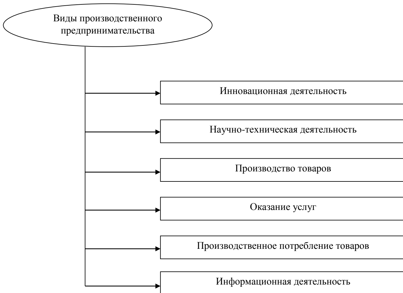
Рисунок 1 – Виды производственного предпринимательства

Виды производственного предпринимательства схематично представлены на рисунке 1.