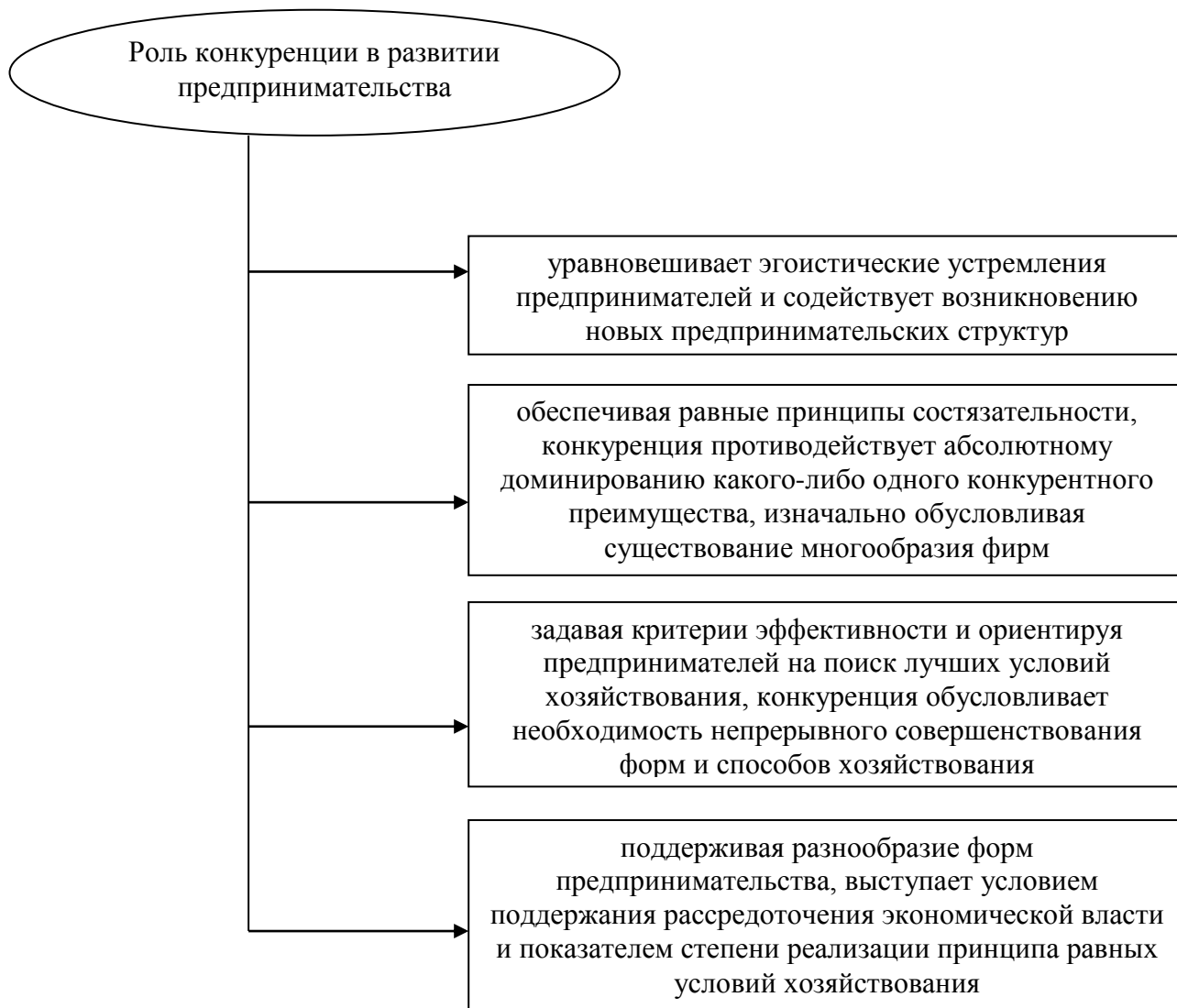
Рисунок 1 – Роль конкуренции в развитии предпринимательства

предпринимательских структур, то это многообразие, в свою очередь, выступает фактором, с одной стороны, поддержания интенсивности конкуренции, а с другой - развития форм и методов конкурентной борьбы. Следствием развития предпринимательства стало смещение центра приложения состязательных усилий от ценовых форм конкуренции к неценовым способам борьбы, на смену которым приходит борьба за рыночное лидерство.