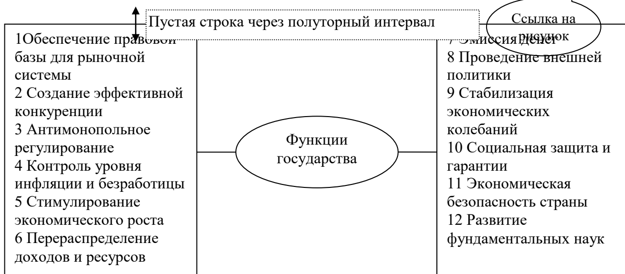
Рисунок 1 – Экономические функции государства

Рассмотрим основные экономические функции государства (рисунок 1).