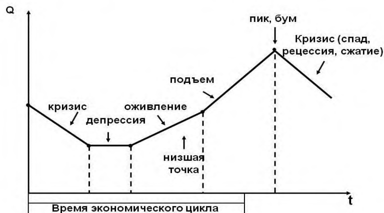
Рисунок 1 – Фазы экономического цикла

Цикличность экономического развития - это непрерывные колебания рыночной экономики, когда рост производства сменяется спадом, повышение деловой активности - понижением. Цикличность характеризуется периодическими взлетами и падениями рыночной конъюнктуры. Периоды повышения экономической активности характеризуются преимущественно экстенсивным развитием, а периоды понижения экономической активности - началом преимущественно интенсивного развития. Следовательно, цикл является постоянной динамической характеристикой рыночной экономики, без 'него нет развития экономики. Экономический цикл - это форма движения и развития рыночной экономики.