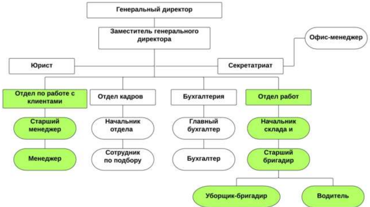
Рисунок 4. Организационная диаграмма.

4) Создайте организационную диаграмму как показано на рисунке 4.