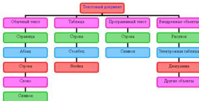
Рисунок 4. Организационная диаграмма.

4) Создайте организационную диаграмму как показано на рисунке 4.