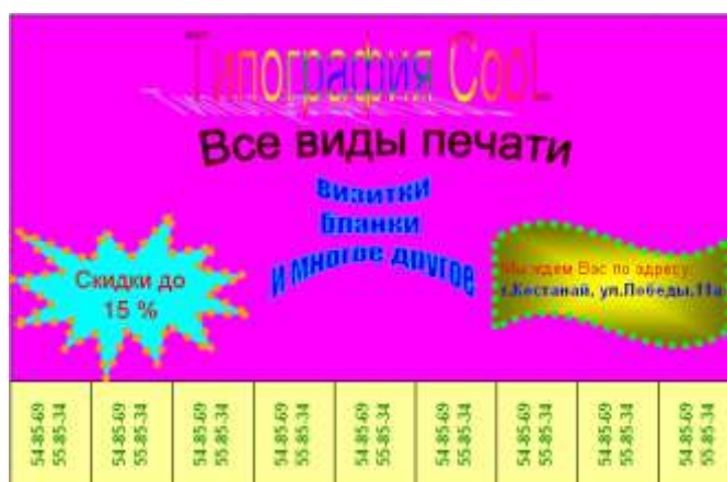
Рисунок 2. Объявление в MS Word.

2) На второй странице созданного документа в программе MS Word создайте объявление как показано на рисунке 2, используя при этом таблицу.