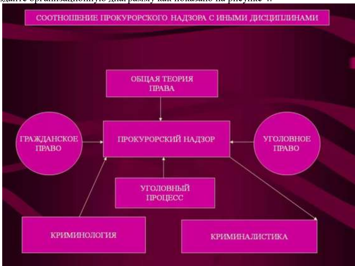
Рисунок 4. Организационная диаграмма.

4) Создайте организационную диаграмму как показано на рисунке 4.