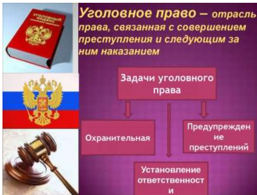
Рисунок 2. Объявление в MS Word.

2) На второй странице созданного документа в программе MS Word создайте рисунок как показано на рисунке 2.