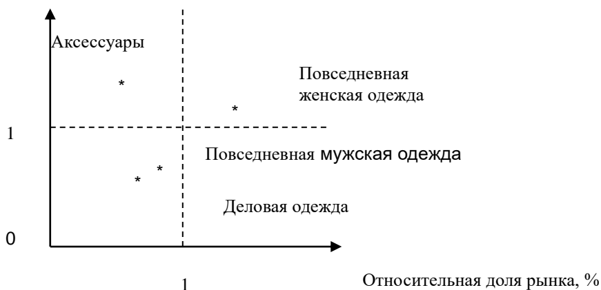
Рисунок 2 – Конкурентоспособность товаров бренда MANGO

В соответствии с долей рынка и темпом роста реализации товаров в зоне «Трудных детей» находится товарная группа «Аксессуары». «Звездами» является женская повседневная одежда, со снижающимся темпом роста. Эта ассортиментная группа практически перешла в зону «дойных коров».